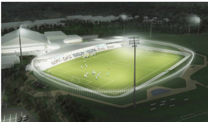
NOVA5 arkitekter A/S illustration af det nye Helsingør Stadion.

Der gik 2,5 år fra kommunens endelige beslutning om at udskifte Helsingør Stadion fra 1923 til et nyt og moderne stadion, der lever op til nutidens krav og behov, stod klar til indvielse. Forløbet undervejs blev alt andet end forudsigeligt. Opdagelsen af en slaggeforurening betød, at 4.000 tons forurenede jord måtte fjernes. Under gravearbejdet fandt man granater og en gammel sø, som ingen kendte til. Brand i en skurvogn og en forfærdelig arbejdsulykke var også med til at udskyde byggeriet flere gange.